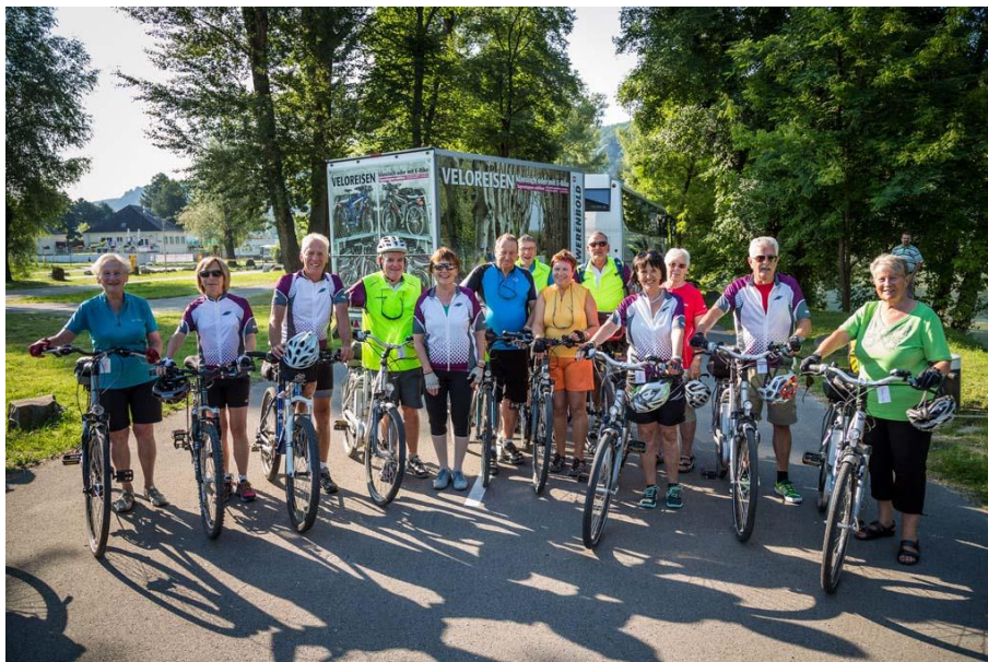
Aktives Geniessen in guter Gesellschaft.